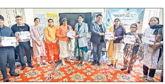
झज्जर। शिक्षकों को प्रमाण पत्र प्रदान करते हुए अधिकारी।