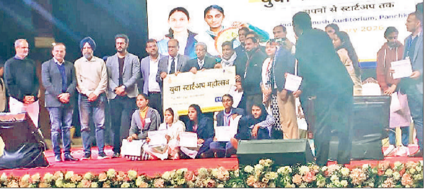
झज्जर। कुशल बिजनेस चैलेंज के दौरान मंच पर उपस्थित छात्राएं व शिक्षक।