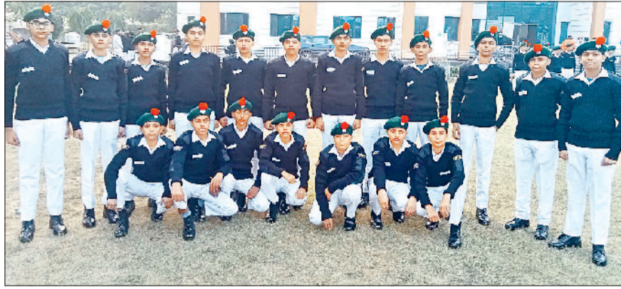
झज्जर। प्रशिक्षण शिविर में उपस्थित एनसीसी कैडेट्स।