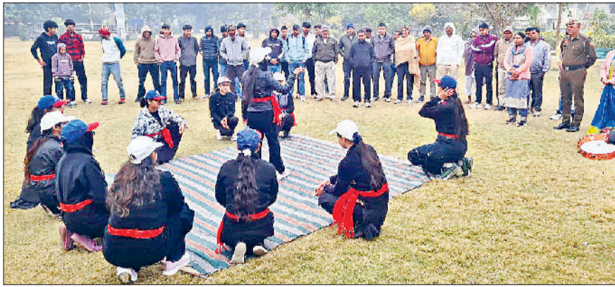
झज्जर। सड़क सुरक्षा और नशे के दुष्प्रभाव के प्रति जागरूक करते हुए छात्राएं।