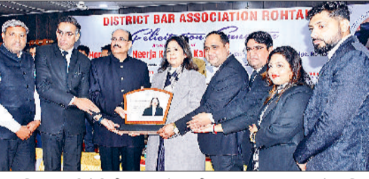
रोहताक। हरियाणा हाईकोर्ट की जज बनने पर नीरजा कुलवंत कलसन को स्मृति चिह्न भेंट करते जिला प्रशासन और बार एसोसिएशन के पदाधिकारी।

रोहताक की सेशन जज से हरियाणा हाईकोर्ट की जज बनीं नीरजा कुलवंत कलसन के सम्मान में जिला बार एसोसिएशन की ओर से भव्य समारोह का आयोजन किया गया। इस अवसर पर जिला प्रशासन और बार एसो.के पदाधिकारियों ने उन्हें स्मृति चिह्न भेंट कर सम्मानित किया। कार्यक्रम के दौरान कई भावुक और रोचक पल देखने को मिले, जिनमें सबसे खास रहा एक युवा वकील द्वारा जज के पैर छुकर