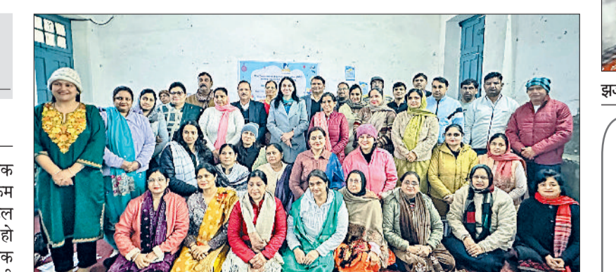
बहादुरगढ़। प्रशिक्षण शिविर के पहले दिन डीईओ के साथ प्राथमिक शिक्षक।